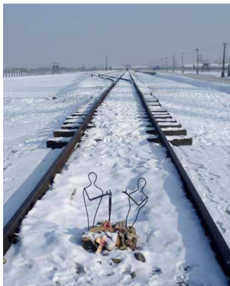
Il binario del campo di Auschwitz-Birkenau

Cerimonia di deposizione di una corona di alloro al monumento dedicato alle vittime dei lager nazisti e di tutte le prigionie, alla presenza delle autorità civili e militari, dei rappresentanti delle associazioni combattentistiche e d'arma e di una delegazione studentesca